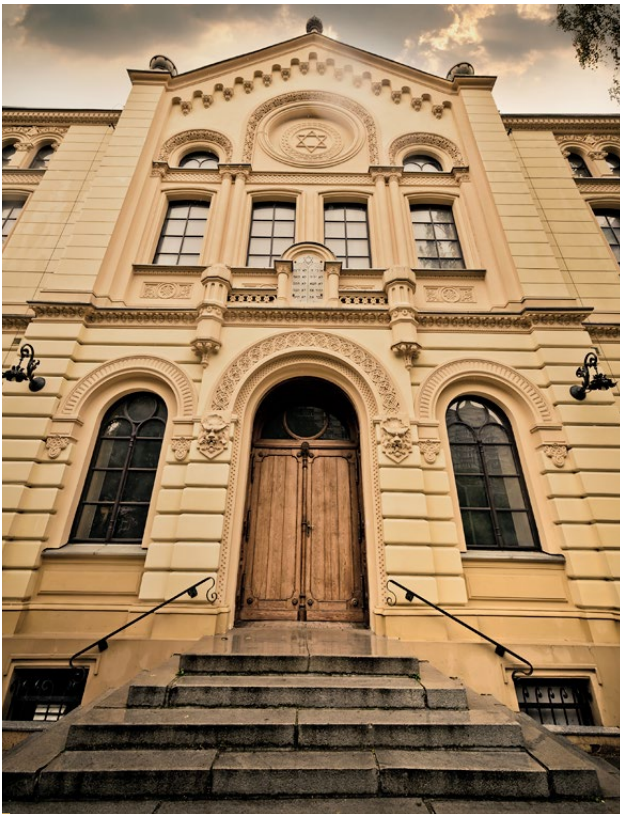
Synagoga im. Nożyków w Warszawie.