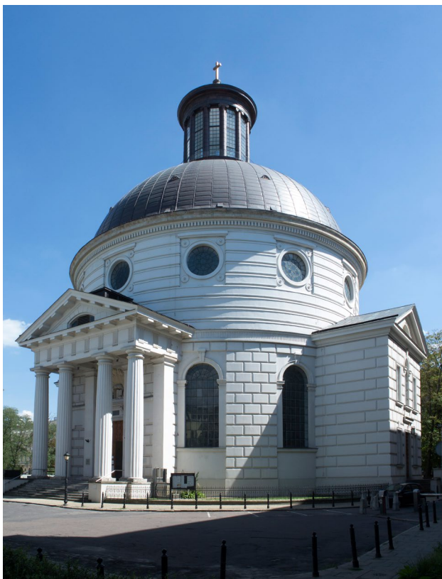
Kościół ewangelicko-augsburski Świętej Trójcy w Warszawie.