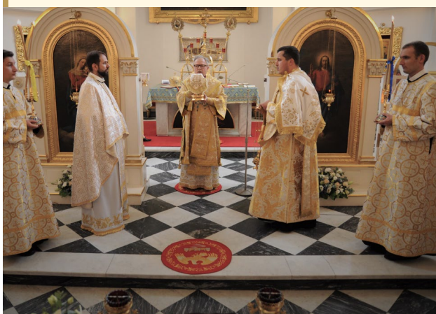
Msza św. w cerkwi bazylianów.