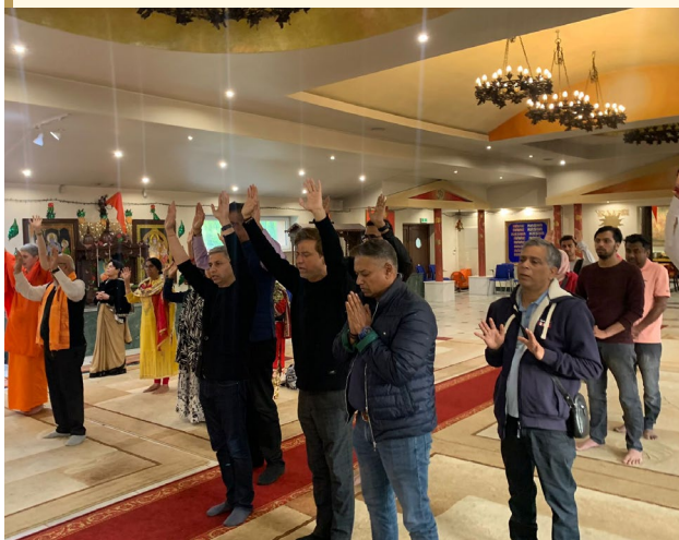
Wnętrze świątyni Hindu Bhavan. Fot. Archiwum Związku Wyznaniowego Hindu Bhavan Mandir w Rzeczypospolitej Polskiej