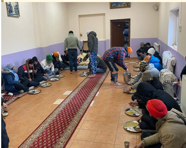
Spotkanie społeczności w gurudwarze Singh Sabha.