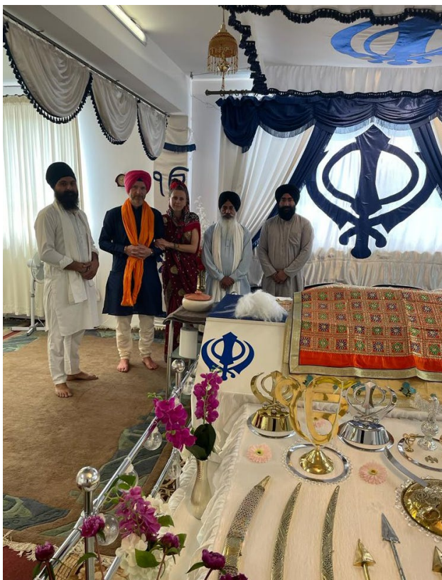
Uroczystość w gurudwarze Singh Sabha.