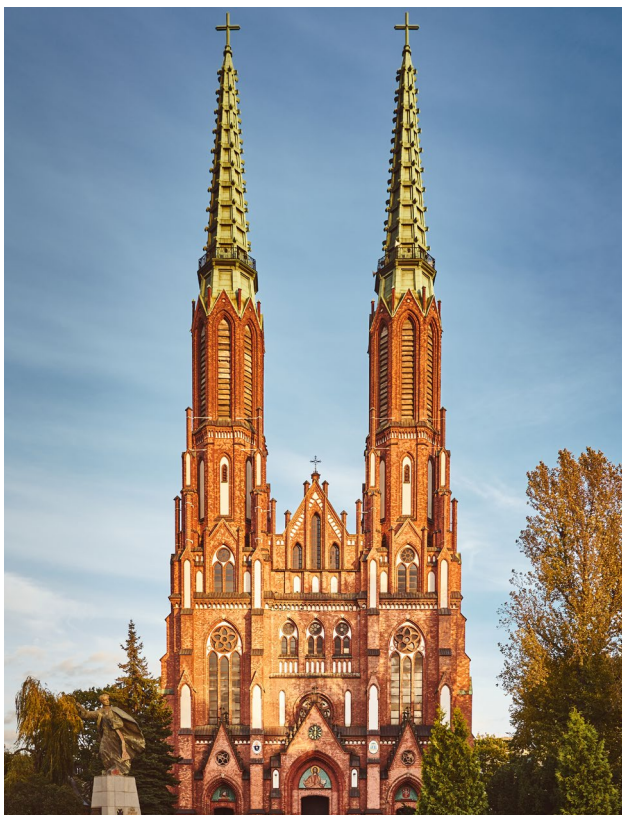
Bazylika katedralna Świętych Michała i Floriana.