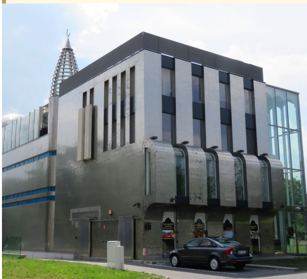
Ośrodek Kultury Muzułmańskiej.