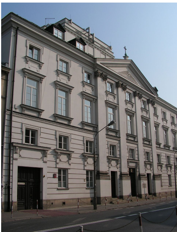
Widok klasztoru i cerkwi bazylianów na Miodowej 16.