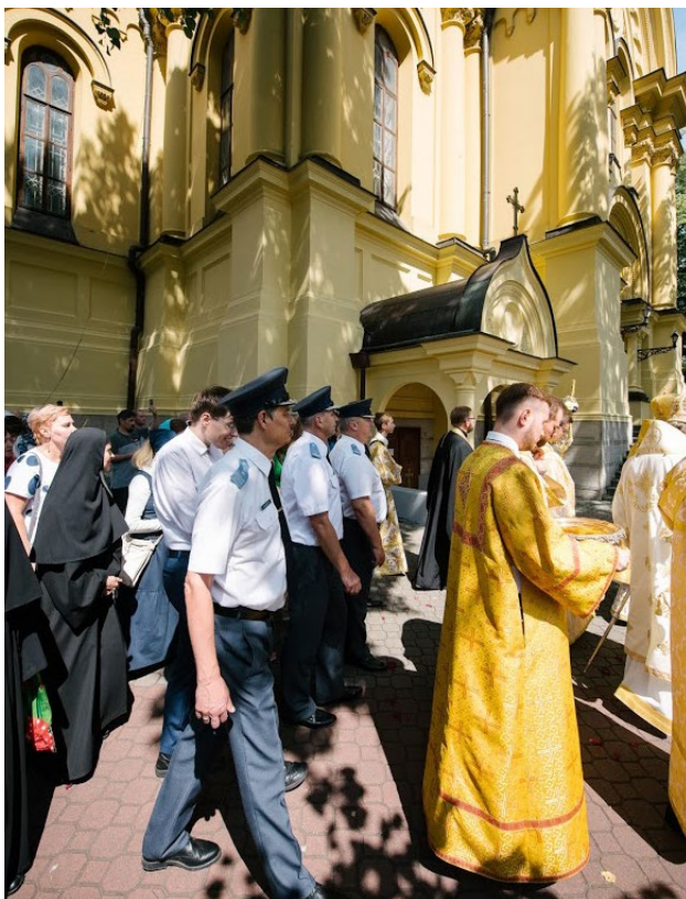
Obchody jubileuszu katedry na Pradze.