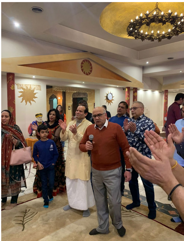
Uroczystości w świątyni Hindu Bhavan.