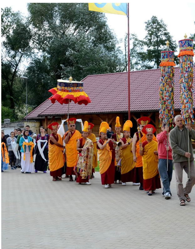
Wizyta Sangye Nyenpa Rinpochena w Warszawie we wrześniu 2015 roku.