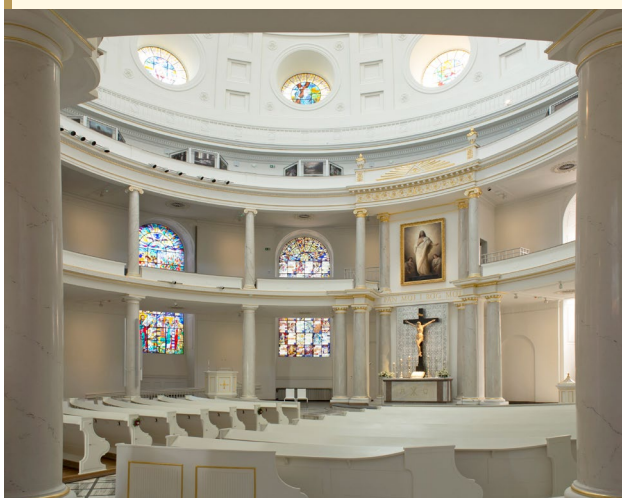
Wnętrze kościoła Świętej Trójcy w Warszawie.