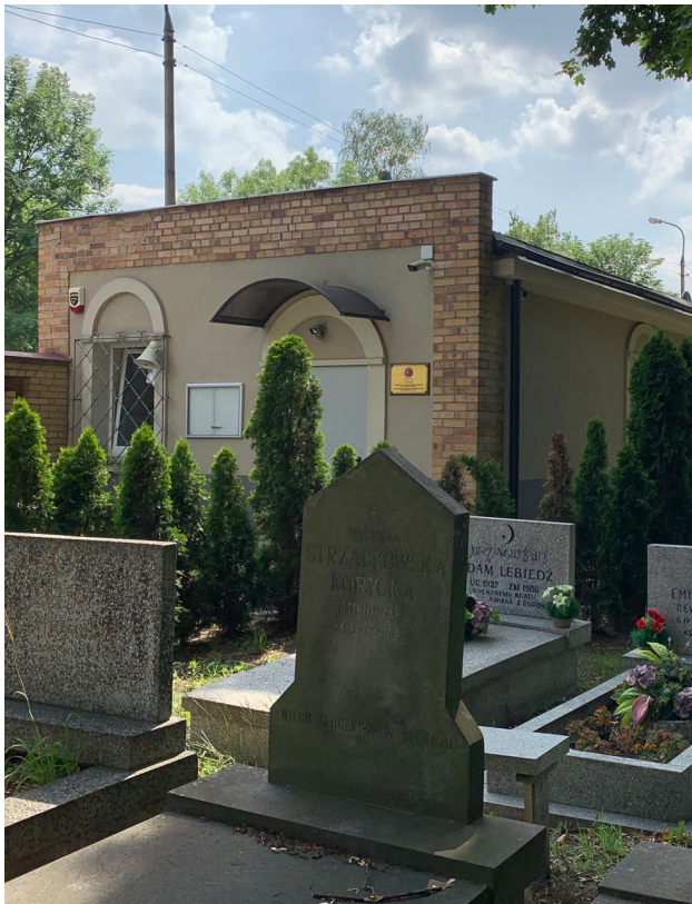
Muzułmański Cmentarz Tatarski sala modlitwy, Warszawa.