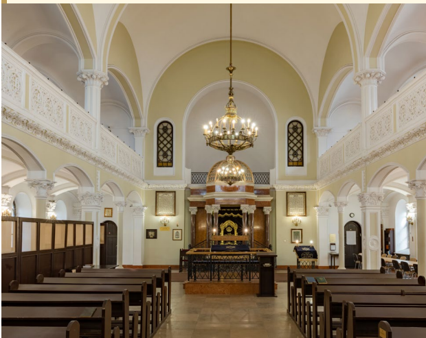
Synagoga im. Nożyków, wewnątrz.