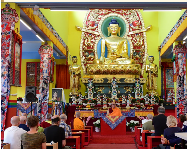
Świątynia buddyjska w Jaktorowie pod Warszawą.